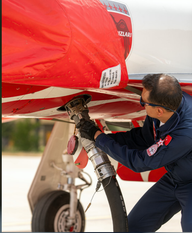
Canon EOS 5D Mk4+ EF 70-20000mm F:2.8L IS II USM | ISO100, F:4, 1/500

Türk Yıldızları pilotu olmak, Türk Hava Kuvvetleri'nin profesyonelliğinin bir kanıtıdır. Ekip için seçilen pilotlar, genellikle çeşitli savaş uçaklarında binlerce uçuş saati olan deneyimli savaş pilotlarıdır. Eğitim süreci, bir dizi ileri akrobasi tekniği ve formasyon uçuşunu kapsayan kapsamlı bir süreçtir. Konya Hava Üssü üzerindeki günlük eğitim uçuşları filonun rutininin çekirdeğini oluşturur. Her manevra hassasiyet, senkronizasyon ve güvenlik sağlamak için tekrar tekrar prova edilir. Yerde yapılan tatbikatlar ve simülasyonlar bu uçuşları tamamlayarak pilotları acil durumlar da dahil olmak üzere çeşitli senaryolara hazırlar. Bu bütünsel yaklaşım ekibin mükemmellik konusundaki itibarını korumaktadır.