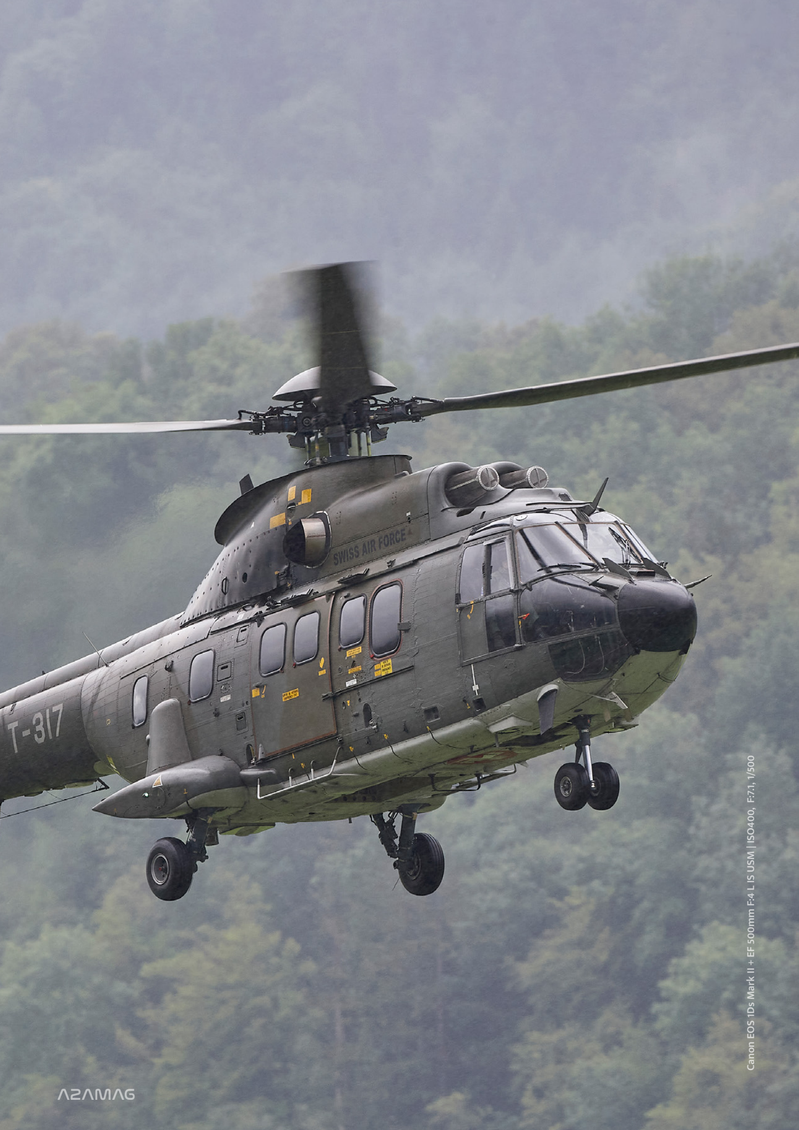
Canon EOS 1Ds Mark II + EF 500mm F:4 L IS USM | ISO400, F:7.1, 1/500