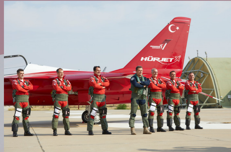
Canon EOS 5D Mk4 + EF 70-200mm F2.8L IS II USM @75mm | ISO100, F:5.6, 1/500