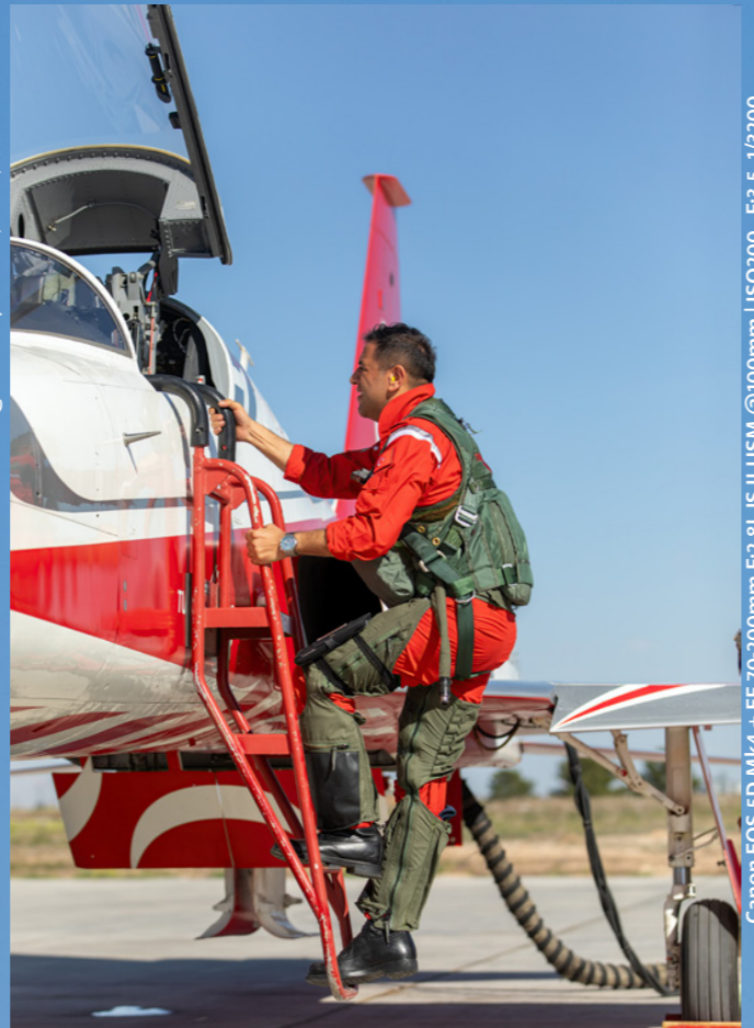
Canon EOS 5D Mk4 + EF 70-200mm F:2.8L IS II USM @100mm | ISO200, F:3.5, 1/3200