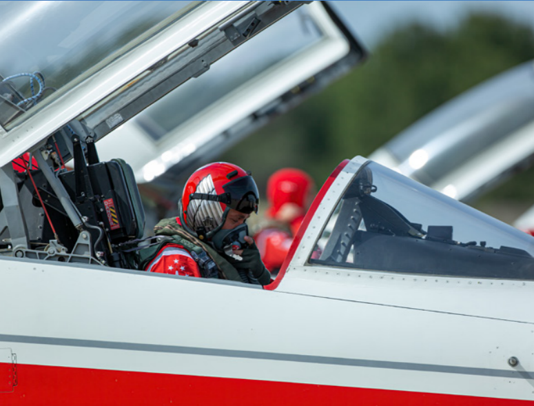
Canon EOS 5D Mk3 + EF 500mm F:4L IS USM | ISO200, F:4, 1/3200