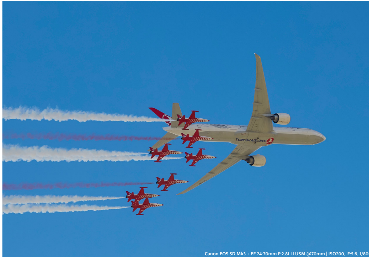
Canon EOS 5D Mk3 + EF 24-70mm F:2.8 II USM @70mm | ISO200, F:5.6, 1/800

Çoğu akrobasi ekibi gibi TÜRK YILDIZLARI da farklı koşullara göre uyarlanmış üç farklı gösteri paketi sunmaktadır: Yüksek, Alçak ve Düz Gösteri Paketleri. Yüksek Gösteri Paketi 9.000 feet (3.000 metre) irtifada, Alçak Gösteri Paketi 4.000 feet (1.300 metre) irtifada ve Düz Gösteri Paketi 1.000 feet (300 metre) irtifada gerçekleştirilir. Her pakette çeşitli formasyon stilleri ve akrobasi manevraları sergilenmektedir. Yüksek ve Alçak gösteriler karmaşık oluşumları ve solo gösterileri vurgularken, Düz Paket daha düşük irtifalara uygun dinamik geçişlere ve sütun oluşumlarına odaklanmaktadır. Bu hava gösterileri sırasında pilotlar, grup hareketlerinde 5.5 - 6G ve solo manevralarda -3 ila +7.33G kuvvetlere katlanarak uçaklarının sınırlarında çalışırlar. Gösteriler 200 ila 520 knot (370 km/sa ila 960 km/sa) arasında değişen hızlarda gerçekleştirilir ve olağanüstü psikomotor beceriler, hassas koordinasyon ve keskin muhakeme gerektirir. Karmaşık formasyonları ve hassas manevralarıyla TÜRK YILDIZLARI, küresel sahnede önde gelen akrobasi ekiplerinden biri olarak tanınmaktadır.