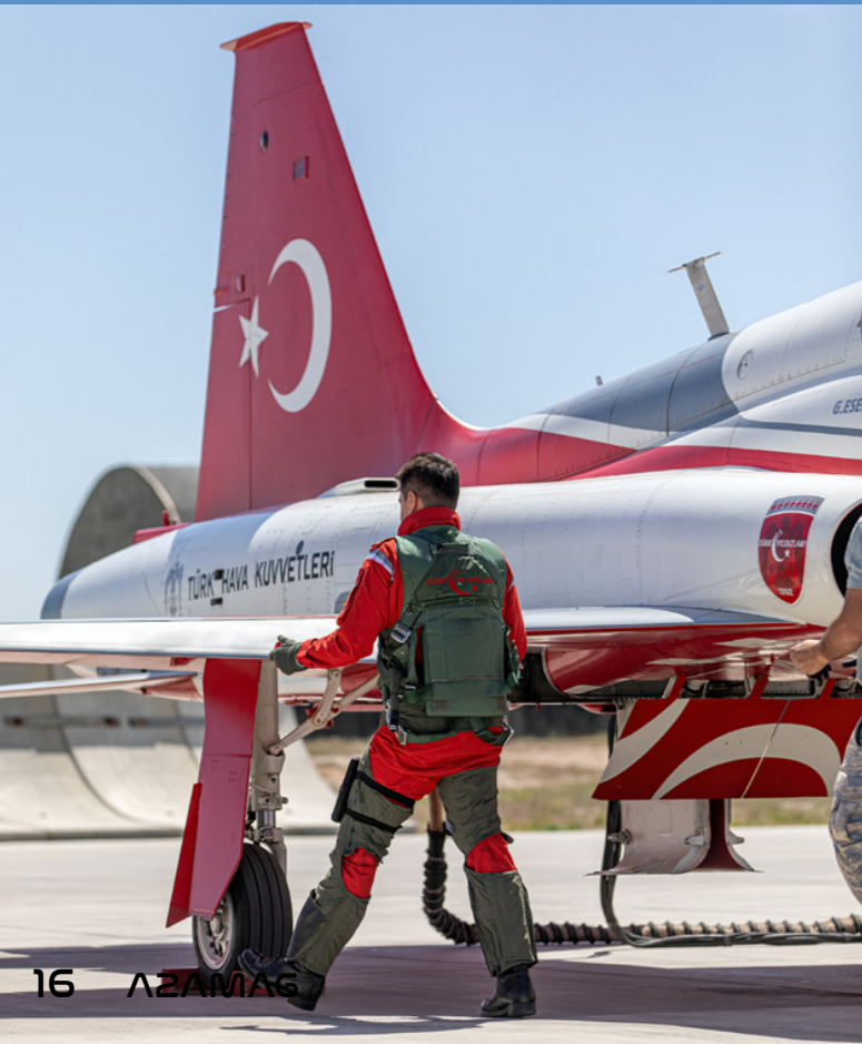
Canon EOS 5D Mk4 + EF 70-200mm F:2.8L IS II USM @125mm | ISO200, F:3.5, 1/3200

Performanslara genellikle izleyiciye göre uyarlanmış müzik ve anlatım eşlik eder; uluslararası performanslarda anlatım yerel dilde yapılır. Bu özenli dokunuşlar, izleme deneyimini geliştirerek performansları daha ilgi çekici ve farklı izleyiciler için ilişkilendirilebilir hale getirmektedir. Küresel etkinliklere katılarak kültürel alışverişe önemli ölçüde katkıda bulunan ve uluslararası iyi niyeti teşvik eden Türk Yıldızları, gösterilerini işbirliğinin, karşılıklı saygının ve ortak havacılık tutkusunun bir sembolü olarak kullanıyor. Hava gösterilerinin ötesinde, Türk Yıldızları gelecek nesil havacılık profesyonellerine ilham vermek için aktif olarak çalışmaktadır. Düzenli olarak okulları ve üniversiteleri ziyaret ederek ilgi çekici sunumlar yapıyor, heyecan verici uçuş gösterileri düzenliyor ve havacılık alanına duydukları sarsılmaz tutkuyu paylaşıyorlar. Bu sosyal yardım çalışmaları, öğrencilere pilotlar ve yer ekibiyle doğrudan etkileşim kurmaları için paha biçilmez fırsatlar sunarak havacılık ve mühendislik alanındaki kariyerler hakkında fikir veriyor. Bu ziyaretler genellikle ekip çalışması, disiplin ve modern havacılığa yön veren teknolojik yenilikler hakkında tartışmalar içermekte, öğrencilerin ufkunu genişletmekte ve onları havacılık ve uzay endüstrisindeki dinamik kariyer yollarını keşfetmeye teşvik etmektedir.