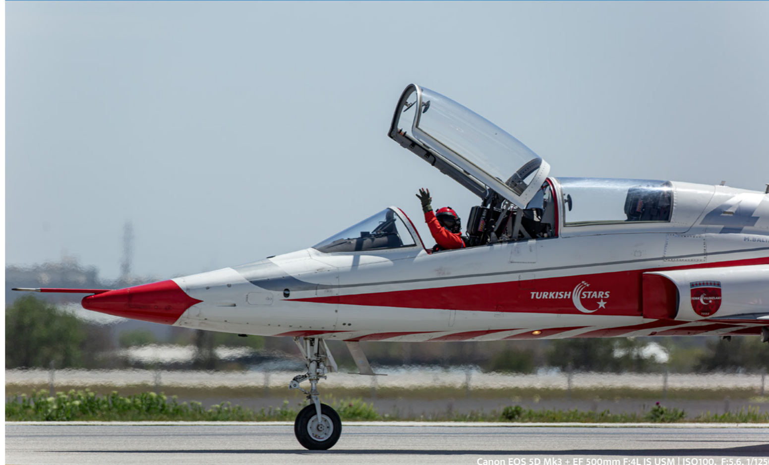
Canon EOS 5D Mk3 + EF 500mm F:4L IS USM | ISO100, F:5.6, 1/1250