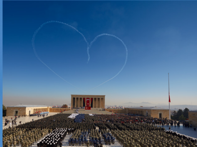
Canon EOS 5D Mk3 + EF 17-400mm F:4L USM @17mm | ISO100, F:6.3, 1/400

Performanslara genellikle izleyiciye göre uyarlanmış müzik ve anlatım eşlik eder; uluslararası performanslarda anlatım yerel dilde yapılır. Bu özenli dokunuşlar, izleme deneyimini geliştirerek performansları daha ilgi çekici ve farklı izleyiciler için ilişkilendirilebilir hale getirmektedir. Küresel etkinliklere katılarak kültürel alışverişe önemli ölçüde katkıda bulunan ve uluslararası iyi niyeti teşvik eden Türk Yıldızları, gösterilerini işbirliğinin, karşılıklı saygının ve ortak havacılık tutkusunun bir sembolü olarak kullanıyor. Hava gösterilerinin ötesinde, Türk Yıldızları gelecek nesil havacılık profesyonellerine ilham vermek için aktif olarak çalışmaktadır. Düzenli olarak okulları ve üniversiteleri ziyaret ederek ilgi çekici sunumlar yapıyor, heyecan verici uçuş gösterileri düzenliyor ve havacılık alanına duydukları sarsılmaz tutkuyu paylaşıyorlar. Bu sosyal yardım çalışmaları, öğrencilere pilotlar ve yer ekibiyle doğrudan etkileşim kurmaları için paha biçilmez fırsatlar sunarak havacılık ve mühendislik alanındaki kariyerler hakkında fikir veriyor. Bu ziyaretler genellikle ekip çalışması, disiplin ve modern havacılığa yön veren teknolojik yenilikler hakkında tartışmalar içermekte, öğrencilerin ufkunu genişletmekte ve onları havacılık ve uzay endüstrisindeki dinamik kariyer yollarını keşfetmeye teşvik etmektedir.